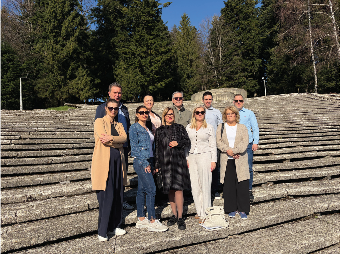
Радна група за израду документа Мапа пута